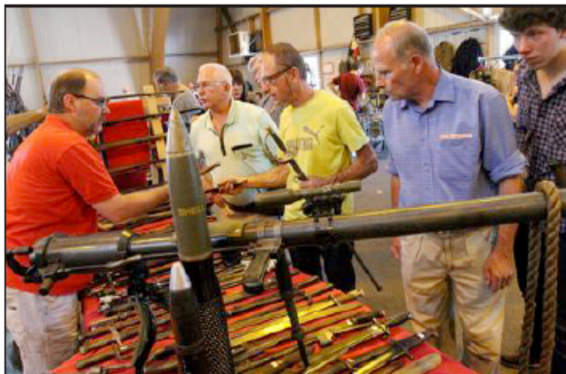
Les baïonnettes, épées et hallebardes ne sont pas des armes blanches, au sens où l'entend la loi actuelle.