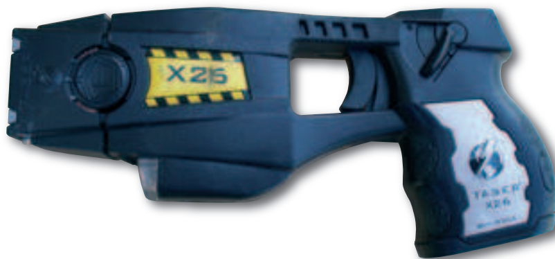
Le Taser n'est pas une arme à feu et à ce titre exclu de la directive européenne. Ou va-t-il être classé lors de la transposition ?

La position de l'ADT est ferme sur un point. Le droit des armes est un droit fon-