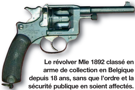
Le revolver Mle 1892 classé en arme de collection en Belgique depuis 18 ans, sans que l'ordre et la sécurité publique en soient affectés.

mentation des armes. Comme la directive du 18 juin 1998, modifiée laisse aux états membres la liberté de définir les armes de collection, il va de soit que les armes d'un modèle antérieur à 1889 et fabriquées ultérieurement devraient automatiquement être considérées ainsi, comme celles qui correspondent aux critères suivants 4 :