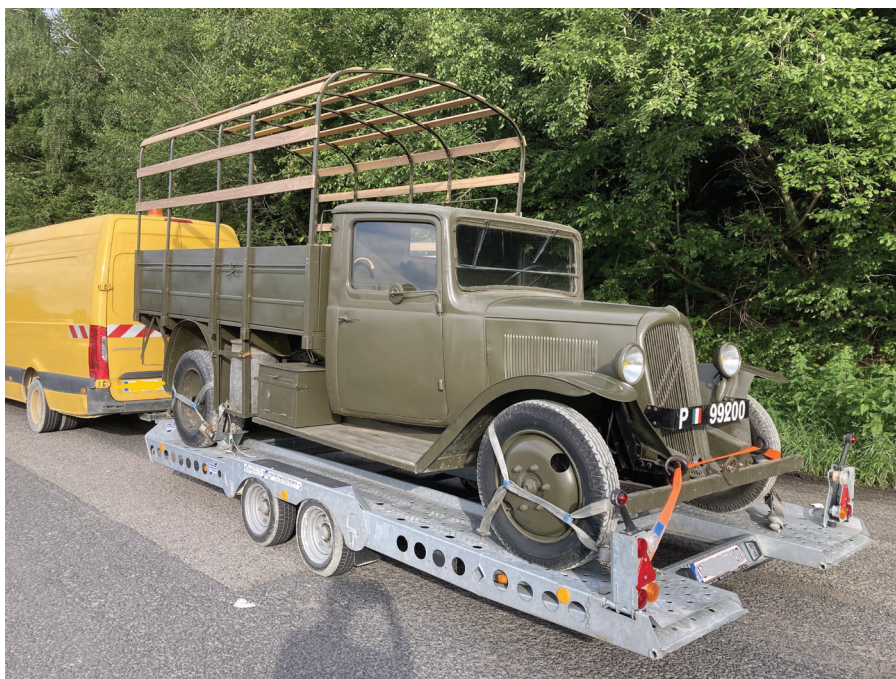
Pour pouvoir tracter son Citroën 23 LU de 1940, ce collectionneur doit être titulaire au minimum du permis BE. L'ensemble camionnette + remorque + véhicule ancien a un PTRA supérieur à 4250 kg.

Toutefois le législateur a laissé une possibilité au simple titulaire de