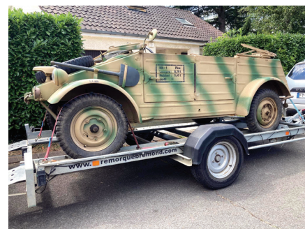
Le permis B est suffisant pour tracter la Kübelwagen Lili! L'ensemble VM +remorque+Kübel est d'un PTAC inférieur à 3500 kg.

Elle est dispensée par les auto-écoles et consiste en deux heures de formation théorique, deux heures de formation pratique hors circulation et trois heures de formation pratique en circulation. Ce dispositif introduit par la loi du 19 janvier 2016